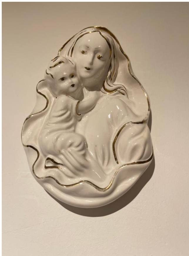
Madonna, Malta